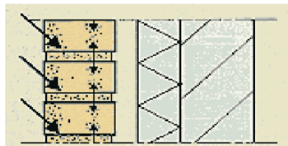
Metselwerk neemt tijdens de uitvoering water op uit de mortel en door regen. Oplosbare stoffen komen hoofdzakelijk in de mortel voor.

Het nemen van beschermende maatregelen blijft regelmatig achterwege onder druk van een strakke bouwplanning en een hoog bouwtempo. Onder ongunstige klimaatomstandigheden verloopt het bindingsproces in de metselmortel slecht en kunnen oplosbare stoffen in de metsel- en/of voegmortel aanwezig blijven. Deze worden normaal bij een goed verloopende verharding wel gebonden. Ook in de baksteen aanwezige stoffen kunnen door een overvloedige regenbelasting tot uitslag leiden.