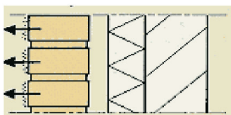
Water verdampst en de stoffen worden als witte uitbloei zichtbaar aan het oppervlak.

In zowel het voorjaar als het najaar komen na een paar droge, zonnige dagen, voorafgegaan door een langdurig natte periode, de nog niet gebonden stoffen door capillair watertransport naar het steenoppervlak.